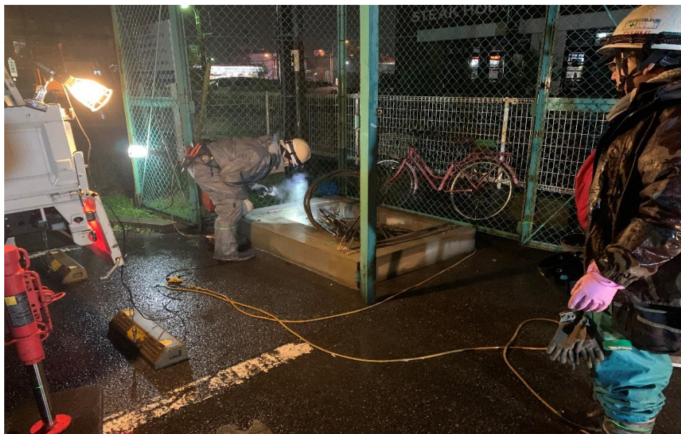
既存キュービクル撤去状況